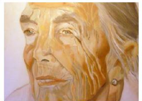
Kunst 'Het leven mag gevierd worden'