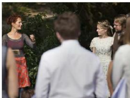
Op de werkvloer Relatievieringen