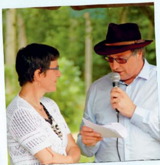
Een kleffe, maar hele mooie ervaring